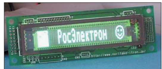
Рис. 3. Индикаторный модуль GU140X16G-7042 с зеленым фоном