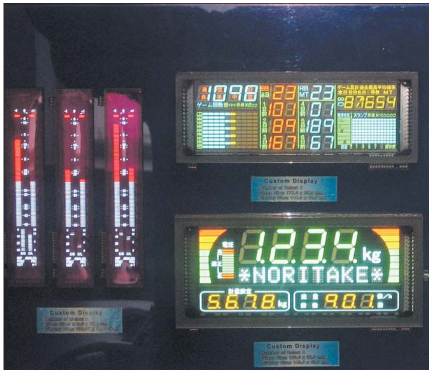
Рис. 1. Заказные VFD-дисплеи

Обычные VFD-дисплеи имеют непрозрачную заднюю стенку. Если сделать ее прозрач-