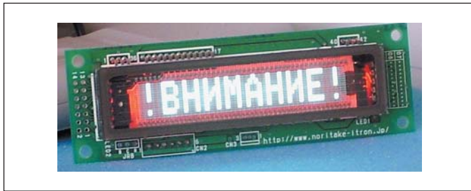
Рис. 4. Индикаторный модуль GU140X16G-7042 с красным фоном