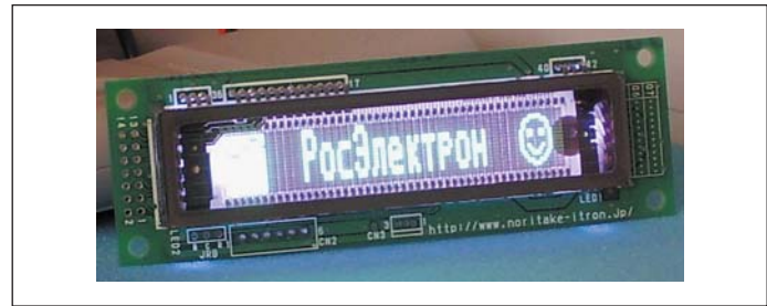
Рис. 5. Индикаторный модуль GU140X16G-7042 со смешанным фоном

ной и поместить сзади цветной источник света, можно получить фон, цвет которого не зависит от цвета основного изображения дисплея. В качестве источника света используются светодиоды, но техническое решение, позволяющее сделать заднюю стенку прозрачной, было не очень простым. Например, многие VFD имеют на задней стенке герметизирующую пластину, поэтому в некоторых случаях пришлось изменить способы герметизации колбы. Для получения равномерного фона используется поверхность блока светодиодной подсветки. Результатом «тюнинга» VFD стали стандартные индикаторные модули на основе дисплеев, снабженные блоками фоновой подсветки.