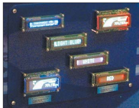
Рис. 6. Индикаторные модули GU140X32F-7042 и GU140X16G-7042

Основная задача VFD-дисплеев состоит в создании сообщения, быстро воспринимаемого пользователем. При этом на первый план выходят яркость, контраст и угол обзора. Но дополнительные возможности, позволяющие реализовать стилистические составляющие и подчеркнуть значение главного сообщения, очень важны с точки зрения эргономики и конкурентных преимуществ. Готовые индикаторные модули NORITAKE ITRON способны не только выводить нужную информацию, но и обращаться к эмоциональной сфере человека. ■