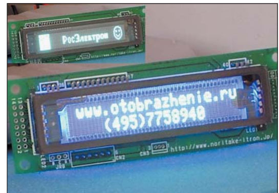
Рис. 2. Индикаторный модуль GU140X16G-7042 с синим фоном. Для сравнения рядом показан модуль с выключенным фоном