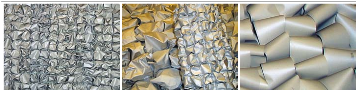
Рис. 3. Образцы радиопоглощающих материалов

личение относительного погонного электро-сопротивления, обнаруженное для НФМП на основе Fe и Co, позволило интерпретировать это явление как естественный ферромагнитный резонанс (ЕФМР), частота которого находится в диапазоне 5–7 ГГц и определяется составом сплава, стеклянной изоляции и геометрическими факторами.