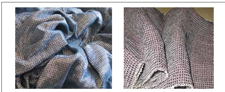
Рис. 4. Образцы электропроводящей ткани с ферромагнитным микропроводом

Предприятие получило лицензию МО РФ на деятельность в области создания средств защиты информации и является аккредитованной испытательной лабораторией восьмого управления Генерального штаба