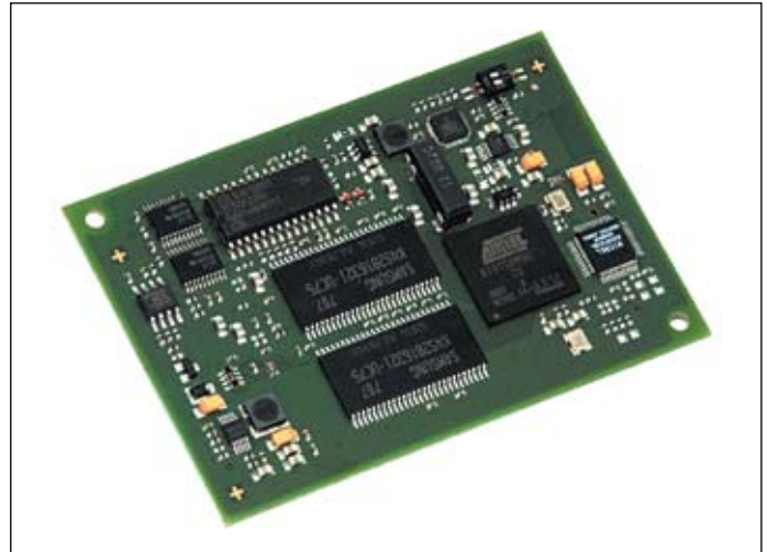
Рис. 2. Внешний вид модуля ECUcore-9G20

Следует отметить, что разработка собственного контроллерного ядра приводит в итоге к ухудшению качества модуля и значительно увеличивает время выхода изделия на рынок. Использование готовых