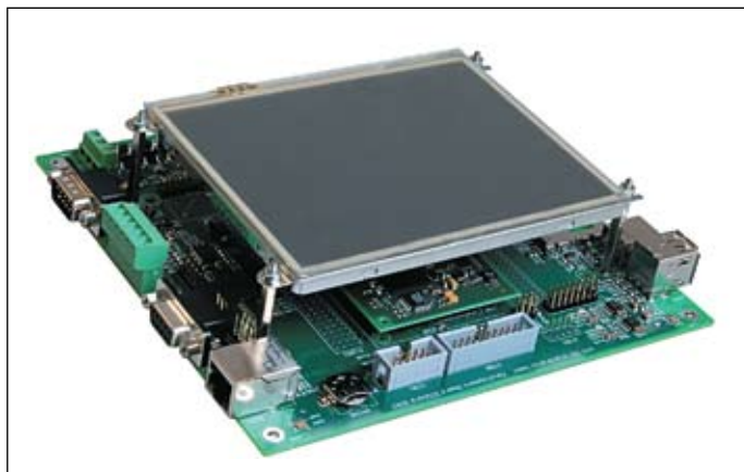
Рис. 1. Отладочная плата SYSTEC