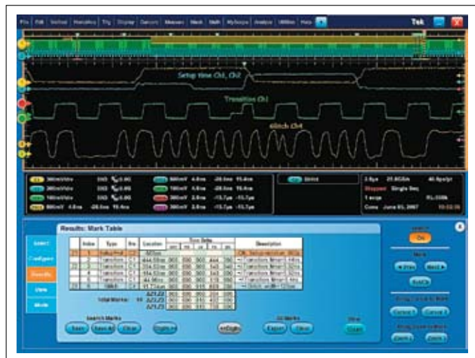
Рис. 3. Расширенный поиск и маркировка событий на осциллографах серии DPO7000

Зачастую причины срыва графика работ и проблемы надежности при разработке новых цифровых продуктов связаны с незамеченными нарушениями целостности сигналов. Теперь разработчики вооружены контрольно-измерительными решениями, позволяющими выявлять и решать сложнейшие проблемы целостности сигналов. ■