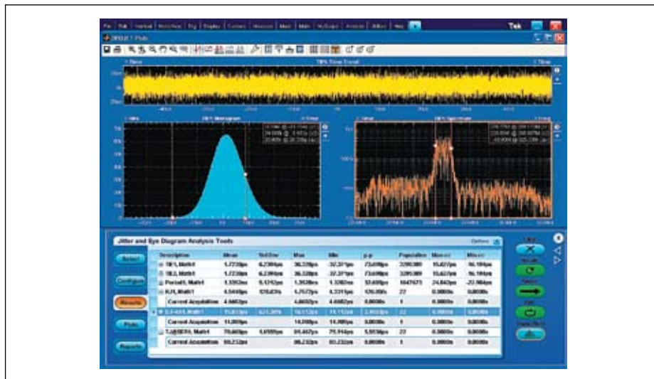
Рис. 2. Программное обеспечение DPOJET для анализа джиттера и построения глазковых диаграмм

Функция расширенного поиска и маркировки (рис. 3) избавляет пользователя от утомительного изучения больших объемов данных, выделяя важные события, пропуская несущественные и улучшая понимание взаимосвязи между событиями. Вы можете быстро перемещаться между интересующими событиями. Имеются также функции поиска и маркировки базовых типов событий (только фронт) плюс поддержка расширенных типов, таких как переходные процессы, установка и удержание или логические комбинации. Функция расширенного поиска и маркировки может сэкономить часы конструкторской работы и позво-