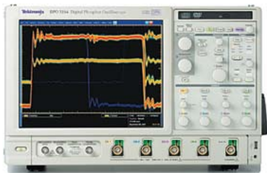
Рис. 1. Отображение редко происходящих событий в сигнале при помощи технологии DPO