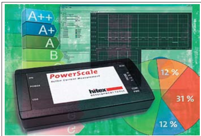
Рис. 1. Модуль PowerScale