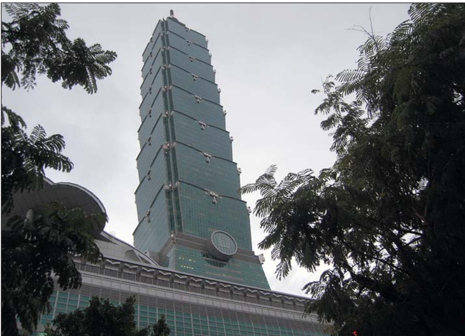
Рис. 1. Самое высокое здание в мире — «Тайбей 101» (Taipei 101)

В целом организация выставки Taitronics значительно отличается от российских выставок. Ощущается сильная поддержка тайваньских организаций, таких как TAITRA и ТЕЕМА, которые продвигают выставки и мероприятия по всему миру и помогают экспонентам. Выставки также активно поддерживает правительство Тайваня: и прези-