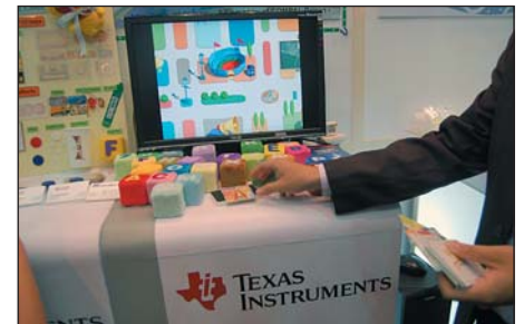
Рис. 2. Развивающая игра iTOYS