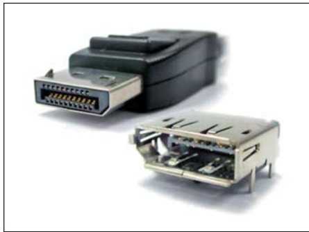
Рис. 3. Разъемы Molex DisplayPort

DisplayPort обеспечивает удобство использования для конечного потребителя. Благодаря фиксаторам, разъем надежно удерживается в сочлененном состоянии. Из других конструктивных особенностей разъемов DisplayPort можно отметить следующие: использование технологии SMT при монтаже разъемов, экранирование разъемов для повышения защиты от электромагнитных помех, наличие дополнительных выводов для надежного крепления разъема к печатной плате.