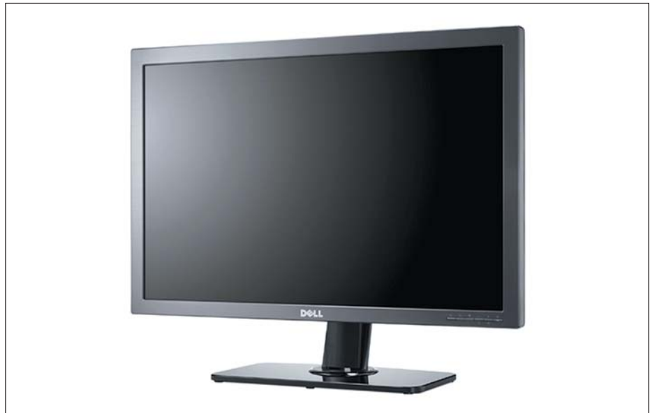
Рис. 4. Плоскопанельный LCD-монитор серии UltraSharp от компании Dell

Одним из главных сторонников скорейшего внедрения интерфейса DisplayPort является компания Dell. В ассортименте предлагаемых компанией Dell плоскопанельных LCD-мониторов серии UltraSharp уже при-