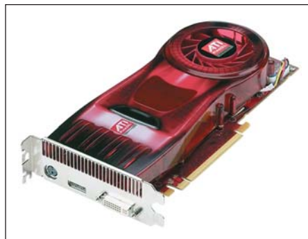
Рис. 5. Профессиональная видеокарта ATI FireGL V7700

Компания AMD объявила об укреплении своих лидерских позиций в сфере графических решений в связи с получением сертификата соответствия стандарту DisplayPort. Сертификацию прошли графические карты се-