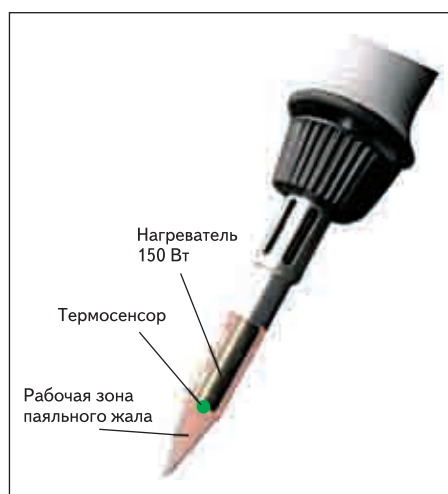
Рис. 2. Позиция нагревателя с термодатчиком в полости жала

С выходом станции i-CON в свет паяльник i-Tool снижал лавры не только самого миниатюрного в отрасли, но и развивающегося небывалую для таких размеров мощность (до 150 Вт) благодаря уникальному нагревательному элементу. Вес паяльника составляет всего 30 г, общая длина — 155 мм, расстояние от рабочего конца паяльного жала до переднего края рукоятки — 45 мм. Тонкий, исключительно гибкий шнур не стесняет движений при работе с паяльником. Несмотря на высокую мощность, передаваемую нагревателем в точку пайки изнутри паяльного жала, температура рукоятки паяльника i-Tool остается в комфортных пределах. Секрет в том, что нагрев локализован поблизости от точки пайки (рис. 2), а не распределен по всей длине паяльного жала, как это имеет место у моделей некоторых конкурентов.