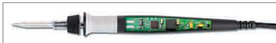
Рис. 3. Встроенный контроллер в рукоятке паяльника i-Tool

Затраты на паяльную станцию складываются из первоначальной цены покупки и последующих платежей, обусловленных заменой изнашивающихся элементов — прежде всего, паяльных жал. Срок службы нагревательного элемента многократно превышает срок износа паяльного жала. Поэтому фирма Ersa в своих разработках последовательно придерживается позиции, приятной кошельку потребителя, а именно: зачем выбрасывать дорогой нагревательный элемент каждый раз, когда выходит из строя дешевое паяльное жало? Этим отличается подход Ersa от конкурентов, предлагающих сменные картриджи, в которых паяльное жало интегрировано с нагревательным элементом (такое решение применяется для максимизации теплопередачи от нагревателя к жалу в условиях, когда запас мощности нагревателя невелик). Применительно к бессвинцовой пайке, темпера-