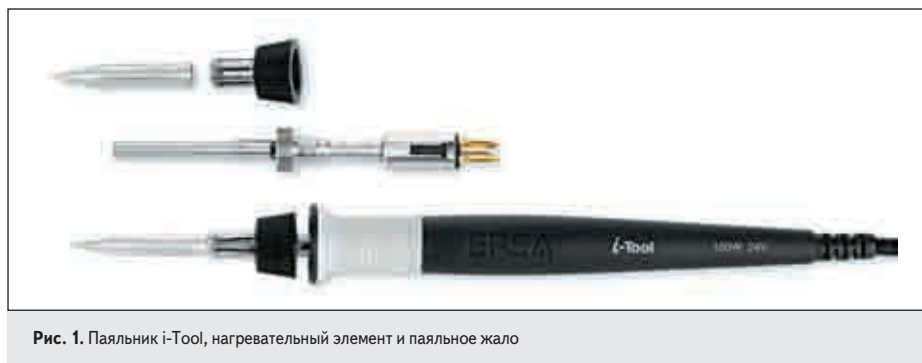
Рис. 1. Паяльник i-Tool, нагревательный элемент и паяльное жало

Как и подобает всякому президентскому посланию, приведенная цитата в концентрированном виде формулирует главную задачу современности и намечает стратегию ее решения. Для профессионального паяльного инструмента основной целью всегда являлось обеспечение должного качества пайки, однако именно в контексте «освобождения от свинца» ручная пайка обретает статус звена особого риска в технологической цепочке. Надежность печатной платы, со-