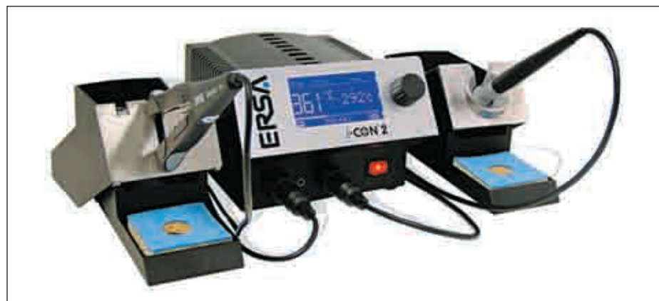
Рис. 4. Вид дисплея с контекстной информацией

Одноканальная станция i-CON выходит на рынок вместе с двухканальной модификацией i-CON2 (рис. 4), имеющей аналогичный управляющий блок. К одному из его разъемов подключается паяльник i-Tool, ко второму — любой из четырех паяльников ERSA (i-Tool, MicroTool, TechTool, PowerTool) или термопинцет ChipTool для демонтажа SMD, или вакуумный термоотсос X-Tool для демонтажа штыревых компонентов. Инструменты распознаются станцией автоматически, и к ним применяются соответствующие алгоритмы управления. Паяльник i-Tool в значительной мере перекрывает области применения MicroTool, TechTool и PowerTool, однако из соображений преемственности все паяльники от станций ERSA Digital2000A могут использоваться и в станциях серии i-CON. Что касается термопинцета ChipTool и термоотсоса X-Tool, то эти монтажные инструменты органично вписались в ремонтные конфигурации новой станции ERSA. К станциям серии i-CON подклю-