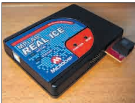
Рис. 5. Внутрисхемный эмулятор REAL ICE

лами, у которых увеличено количество аппаратных точек останова и не используются для отладки пользовательские ресурсы (ОЗУ, выходы).