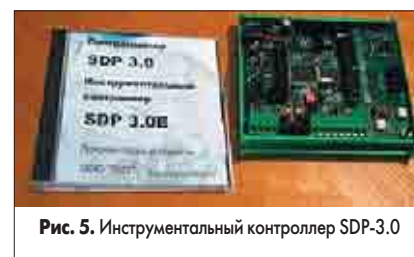
Рис. 5. Инструментальный контроллер SDP-3.0

Контроллер SDP-3.0/E (рис. 5) предназначен для создания интегрированной инструментальной среды отладки микропроцессорных систем. Его основные функции: