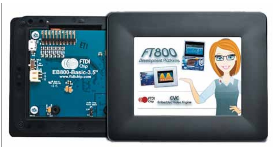
Рис. 1. Графический модуль VM800Vxxx на базе FT800

Вернемся к теме статьи и возможностям FT800. Микросхема поддерживает широкий набор графических функций, работу с сенсорным экраном, воспроизведение звука и ряд команд, управляющих режимами работы. Освоение «с нуля» всего функционального набора может оказаться трудоемкой задачей. Помочь в этом могут примеры производителя, которые демонстрируют работу всех функций микросхемы FT800. Эти примеры хорошо структурированы и могут использоваться в качестве библиотеки функций для применения в собственных проектах и/или понимания принципов управления графическим контроллером.