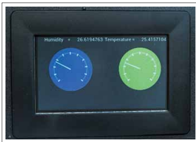
Рис. 4. Информация на дисплее, которая выводится в результате работы примера