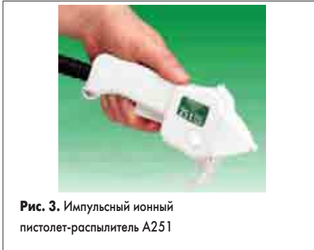
Рис. 3. Импульсный ионный пистолет-распылитель A251

влеченные к объекту статическим потенциалом. Разновидностью локального ионизатора является «ионный пистолет» (ion gun, рис. 3). Извне к рукоятке из антистатического (рассеивающего) пластика подводится шланг от компрессора с давлением воздуха 1,5–7,0 бар и кабель от контроллера импульсной ионизации A232 (на фото не показан). Ионный баланс поддерживается в рамках ±10 В. Уровень шума на расстоянии 1 м при работе ионизирующего пистолета-распылителя составляет 72 дБ при входном давлении 1,5 бар и очевидно нарастает при повышении давления.