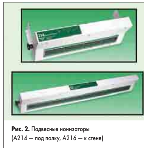
Рис. 2. Подвесные ионизаторы (A214 — под полку, A216 — к стене)

Подвесной ионизатор (undershelf/overhead ionizer, рис. 2) решает проблему препятствий, нередко возникающую при использовании настольного ионизатора. Подвесной ионизатор размещают на высоте 45–60 см над плоскостью рабочего стола. Например, модель ионизатора A214, имеющая габариты 600×200×100 мм и вес 4,6 кг легко крепится под полкой рабочего места PM-1500-ESD, ионизируя объекты на столе в зоне охвата до 800×400 мм. Ионный баланс поддерживается в рамках \pm 5 В. Контрольное время стекания заряда от 1000 до 100 В не превышает 4 с для объектов на расстоянии 457 мм от ионизатора при максимальной (из трех возможных) скорости вентиляторов. Уровень шума на расстоянии 1 м составляет всего 45 дБ при макси-