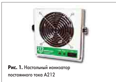
Рис. 1. Настольный ионизатор постоянного тока A212

Настольный ионизатор (bench ionizer, рис. 1) сочетает в себе эффективность и мобильность: его удобно перемещать как в пределах рабочего места, так и с одного стола на другой. Важными факторами при выборе настольного ионизатора являются его размеры и производительность. Крупногабаритный прибор занял бы слишком много места на рабочем столе радиомонтажника, поэтому особенно популярны компактные ионизаторы. Разумеется, ионизатор можно закрепить также на полке или даже на стене: важно лишь, чтобы поток ионизированного воздуха свободно достигал рабочих поверхностей заряженных объектов. Самая малогабаритная модель ионизатора A212 имеет размеры 160×160×95 мм, вес 650 г. Ионный баланс поддерживается ею в рамках \pm 10 В. Контрольное время стекания заряда от 1000 до 100 В не превышает 2,5 с для объекта на расстоянии 305 мм от ионизатора при максимальной (из двух возможных) скорости вентилятора. Уровень шума на расстоянии 1 м составляет всего 46 дБ при пиковой производительности вентилятора 20 л/с. Потребляемая мощность — 12 Вт от импульсного источника по-