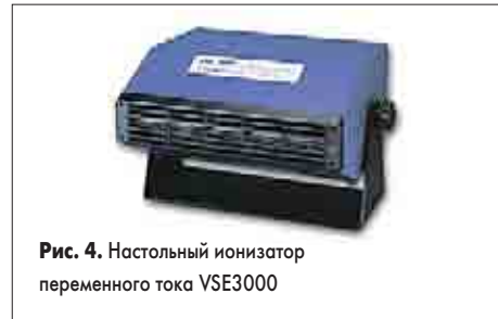
Рис. 4. Настольный ионизатор переменного тока VSE3000